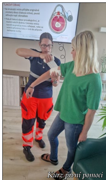
Kurz první pomoci