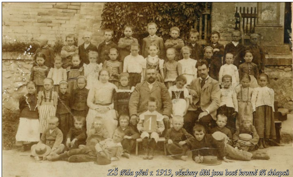
ZŠ třída před r. 1913, všechny děti jsou bosé leomně uří chlapečci