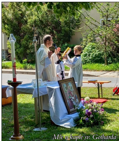
Mše u kaple sv. Gotharda