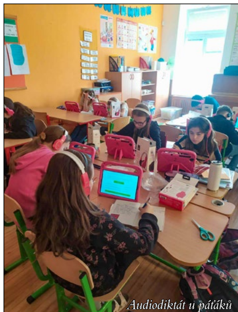
Audiodiktát u páťáků

V prostorách školy vznikají nové kmenové třídy a odborné učebny. Budujeme nové třídy v prostorách, teď už bývalých Pejsků a Koťátek. Připravujeme malou učebnu dílen. Prostor se najde i na učebnu s knihovnou. Víceméně každou kmenovou třídu upravíme tak, aby v ní byla i odborná učebna. Třídy budou vzdušnější a pro naše žáky příjemnější a inspirativnější. Vznikne nám tak celkem deset tříd, které budeme moci využívat na tolik potřebné půlení hodin, v odpoledních hodinách na družiny