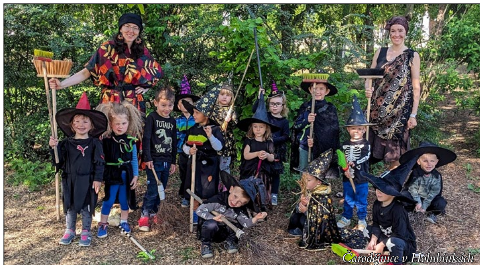
Čarodějnice v Holubinkách