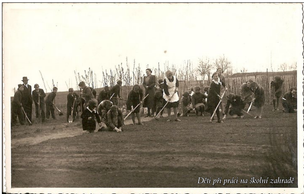
Děti při práci na školní zahradě