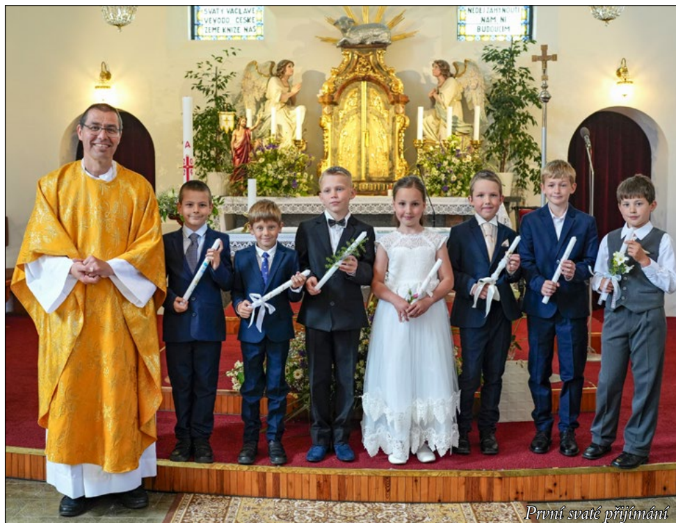
První svatě přijímání