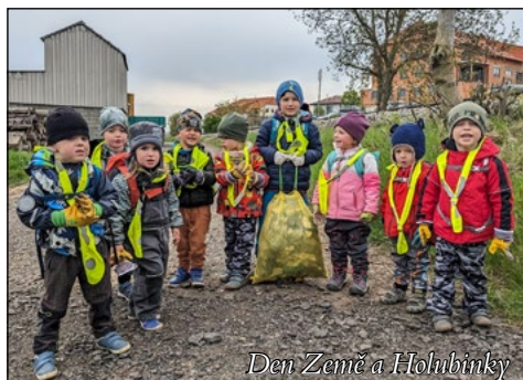
Den Země a Holubinky