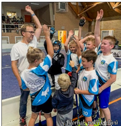
Florbal, pokřik elévů

Elékové i mladší žákyně pokračují ve své florbalové sezoně, kde se oběma družstvům daří. Elékové hrají celosezónně pravidelnou soutěž o herním formátu 3+1 (hráči + brankář) a mají za sebou už pět odehraných turnajů. V této kategorii se snažíme, aby děti spolu uměly vzájemně komunikovat a spolupracovat nejen na hřišti, ale i mimo něj. Osobní konflikty musí jít v tu dobu stranou a děti by se měly zaměřit na hru. Dalším cílem je snaha hráčů nebát se hrát, být odvážní a být rychlejší při přebírání míček. I v tomto směru se