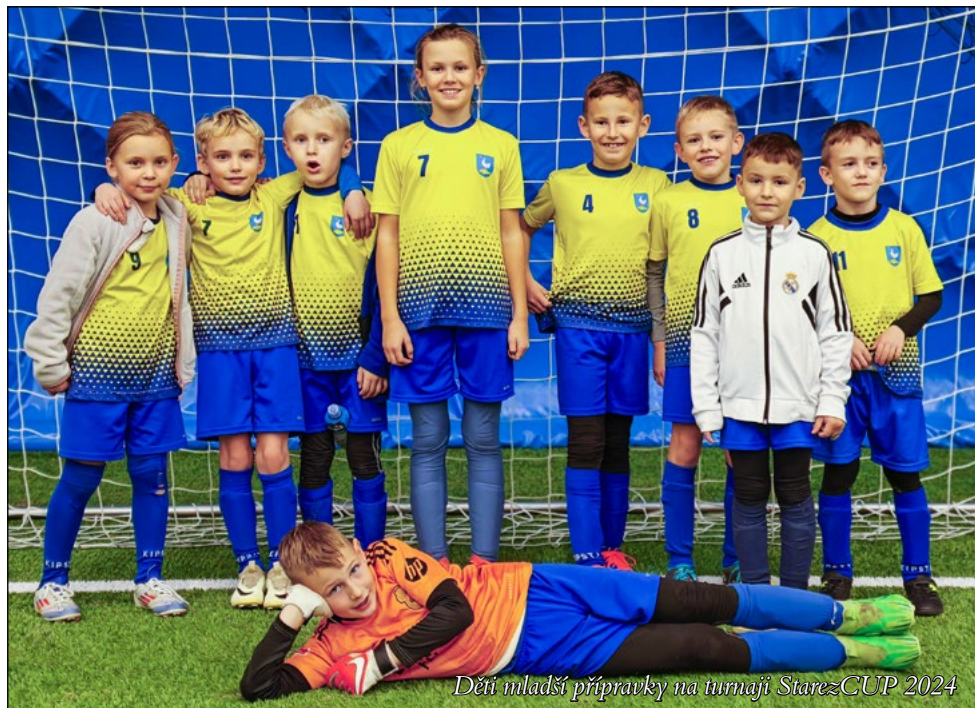
Děti mladší přípravek na turnaji Starez CUP 2024

Mladší přípravek má za sebou první zkušenost se zimním turnajem Starez CUP, který se hraje v nafukovací hale na hřišti s umělým povrchem v Tréninkovém centru v Brněnských Ivanovicích. Naši svěřenci vyhráli pouze jeden zápas proti Tatranu Kohoutovice 2:0. V dalších zápasech se nám nepodařilo vstřelit více gólů, než soupeř. Výsledky zápasů proti jednotlivým týmům byly následující: Lokomotiva HH Brno 2:3, Křenovice 1:5, Pozoříčice 0:1, Sokol Lipovec 1:2 a Ochoz u Brna 0:3. Druhá část turnaje nás čeká 14. prosince.