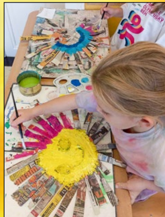
ČERTOVSKÉ REJDEŇÍ VE ŠKOLE