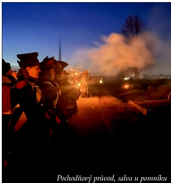
Pochodňový průvod, salva u pomníku