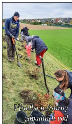
Výsadba u čistírny odpadních vod