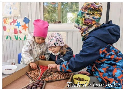
Tvoření v lesní školce

Odpoledne 16. října zahrada lesní mateřské školy ožila. Sešly se zde děti se svými rodiči a s některými prarodiči na akci Jablíčkování. Strávili jsme společně hezký čas při vyrábění pod pergolou, soutěžích na zahradě a při opékání jablíček. A na závěr nás všechny děti potěšily svým milým