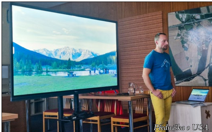
Přednáška o USA