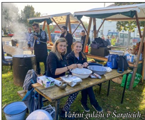
Vaření gulášů v Šaraticích