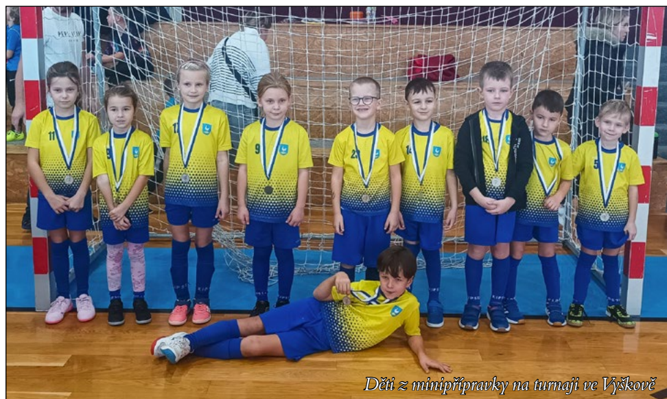
Děti z minipřípravky na turnaji ve Vyškově

Oddíl fotbalu zahájil začátkem listopadu zimní přípravu. Aktuálně trénujeme v hale v Holubicích, a to v pondělí od 17:00 hodin minipřípravka (ročník 2018 a 2019) a předpřípravka (ročník 2020 a 2021 – děti, které zvládnou samostatně trénink), ve středu od 16:30 hodin mladší přípravka (ročník 2016 a 2017) a ve středu od 18:00 hodin starší přípravka (ročník 2014 a 2015).