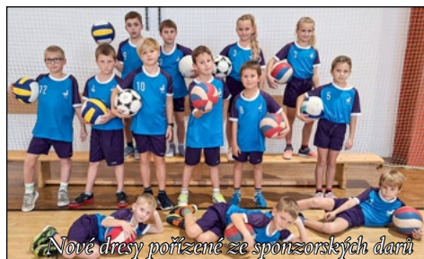
Nové dresy pořízené ze sponzorských darů

A samozřejmě má venkovní výuka spoustu dalších benefitů – pobyt na čerstvém vzduchu, fyzická aktivita, podpora kreativity a představitosti, rozvoj týmové práce a zlepšení duševního zdraví.