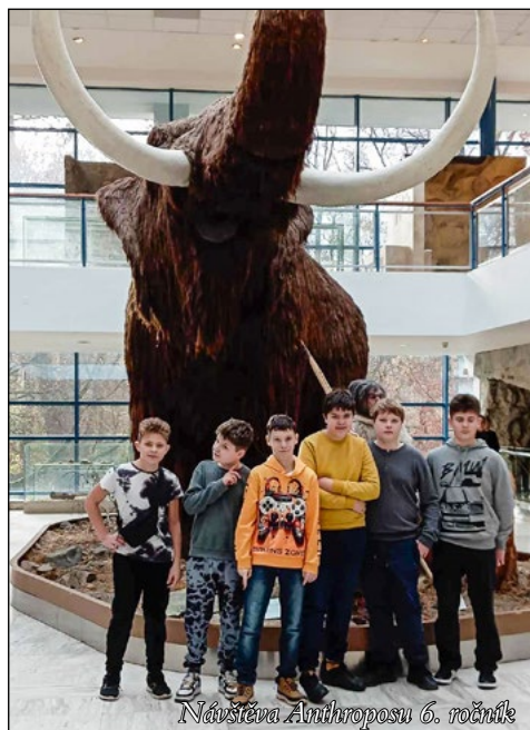
Návštěva Antroposu 6. ročník

To bylo jedním z mála důvodů, proč jsme se v letošním roce zapojili do výzvy pro školy 100 HODIN VENKU. Máme tedy za úkol během jednoho školního roku splnit sto hodin vzdělávání venku skrze