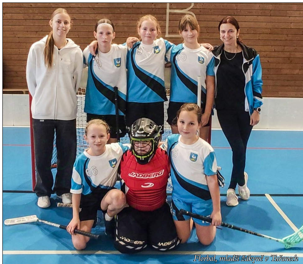
Florbal, mladší žákyně v Tuřanech

Na trénincích se snažíme s dětmi zaměřit nejen na florbal, ale také na sportovní mix od atletiky, obratnosti či kompenzačních cvičení, až po nejrůznější týmové hry.