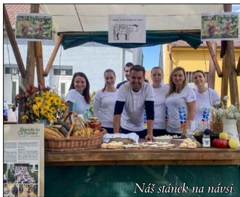
Náš stánek na návsí