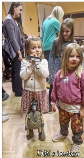
Děti s loutkou