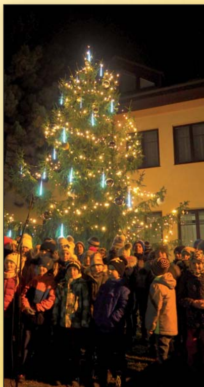
ROZSVĚCENÍ VÁNOČNÍHO STROMU