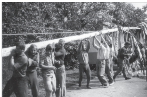
Hody 1970 – stavění máje

V pátek 27. září jste mohli přijít na náves ke kapličce a být svědky stavění máje k Václavským hodům. Dnes si stárci k tomuto účelu zvou jeřáb, který bezpečně a rychle máju usadí do připravené vyztužené jámy. Dříve tomu ale bylo jinak, jak můžeme vidět na fotografii, která byla pořízena počátkem 70. let. Mája se v Holubicích stavěla v Kruhu před hostincem U Omastů, kde bývala hodová zábava a který dnes již neexistuje, v jeho bývalém sále je nyní sklad nábytku. V okolí hostince v pátek navečer postávaly hloučky lidí a děti zvědavě obhlížely nazdobený strom. Muži se stárky se shromáždili u jámy, do které posléze pomocí dřevěných tyčí, lan, žebříků a hlavně silných paží „májku“ umístili.