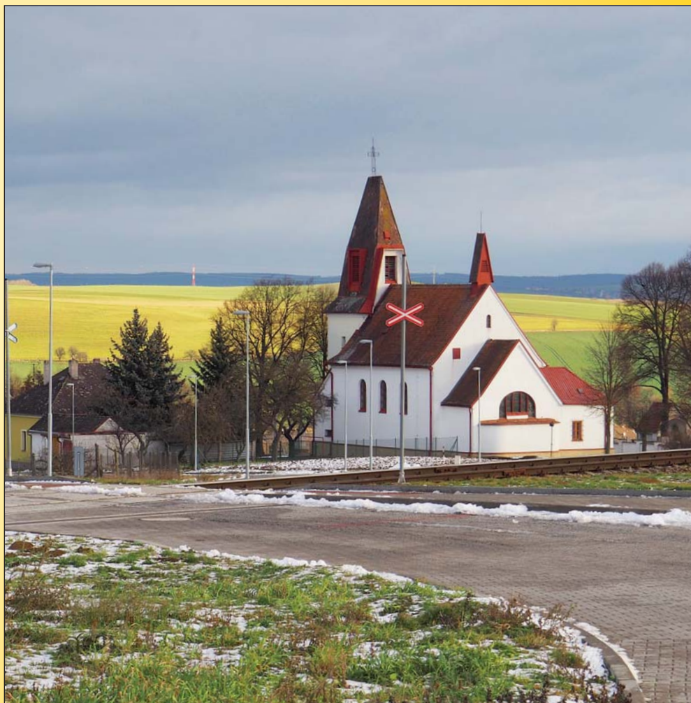
KOSTEL SV. VÁCLAVA V ZIMĚ

ročník 25 • číslo 4 • říjen-prosinec 2019