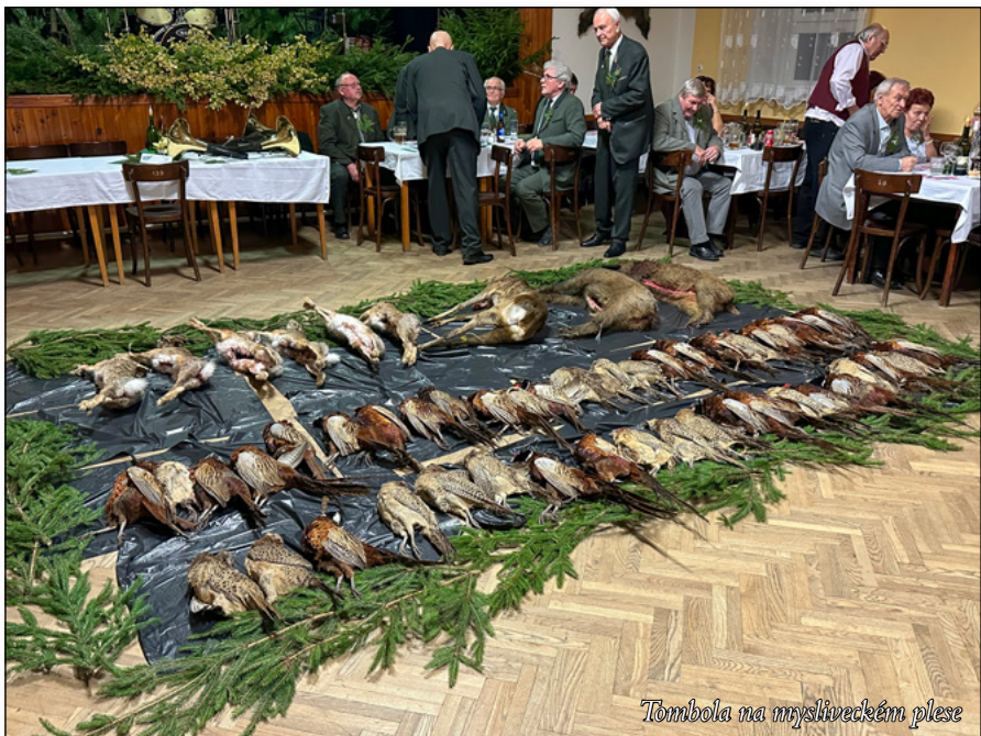
Tombola na mysliveckém plese