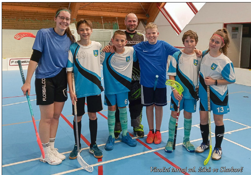
Vánoční turnaj ml. Žáků ve Slavkově