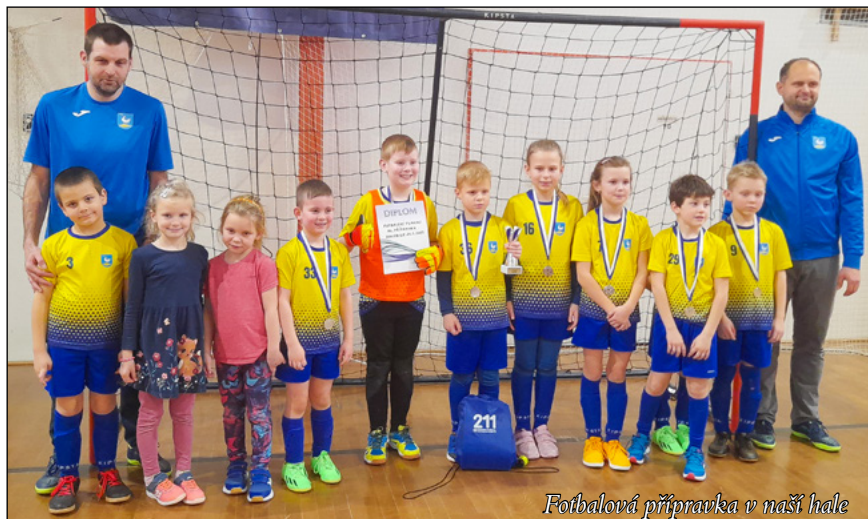
Fotbalová příprava v naší hale