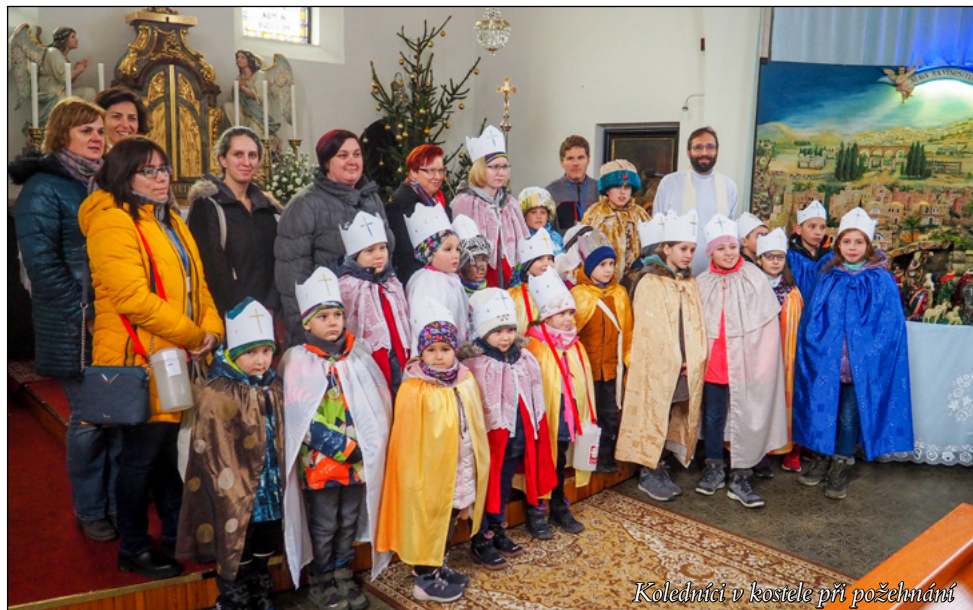
Koledníci v kostele při požehnání

Po požehnání Otcem Václavem v našem kostele sv. Václava se již po třiadvacáté vydali koledníci v Holubicích v sobotu 7. ledna na koledu. Organizátoři sbírky děkují všem dárcům, kteří finančně přispěli do sbírkových pokladniček. Ve sbírce bylo celkem vybráno 77 202 Kč. Tato částka byla předána oblastní Charitě v Rajhradě prostřednictvím Charity České republiky.