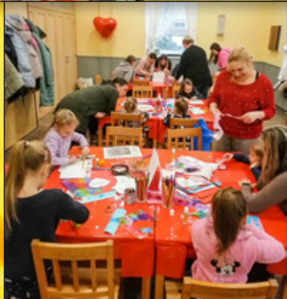
VALENTÝNSKÉ ODPOLEDNE, DÍLNIČKY