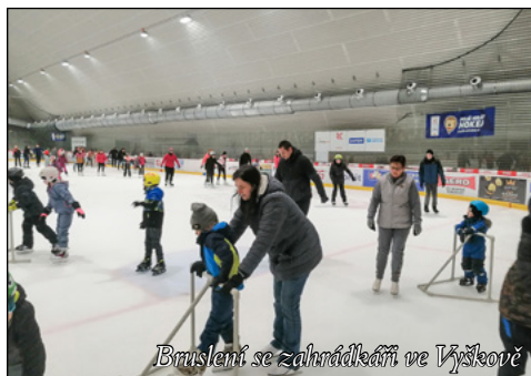
Bruslení se zahradkáři ve Vyškově

Redakce zpravodaje a vedení Obce Holubice Vám přejí příjemné a klidné prožití velikonočních svátků.