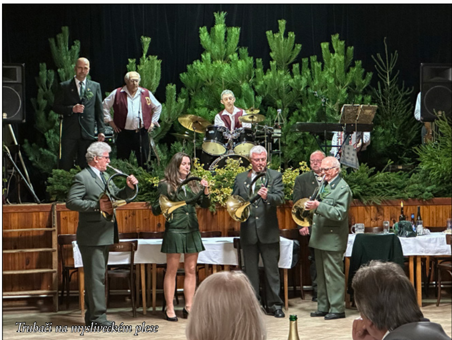
Trubači na mysliveckém plese