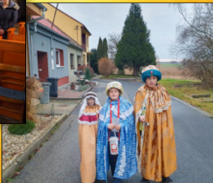
TŘI KRÁLOVÉ V ULICI PODNÁDRAŽÍ