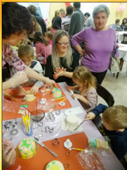
VALENTÝNSKÉ ODPOLEDNE, ZDOBENÍ DORTÍKŮ