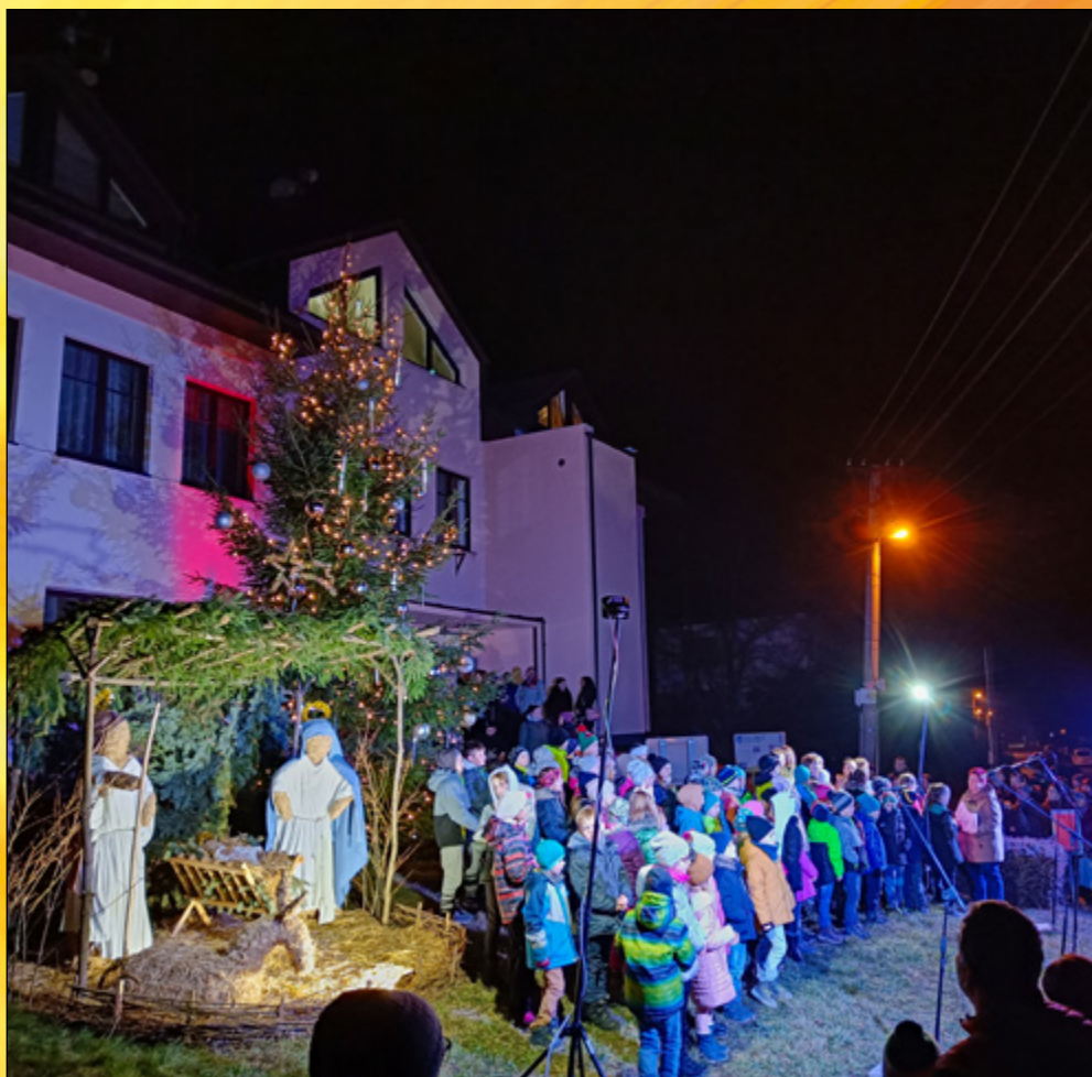
ROZSVĚCENÍ VÁNOČNÍHO STROMU

ročník 28 • číslo 4 • říjen-prosinec 2022