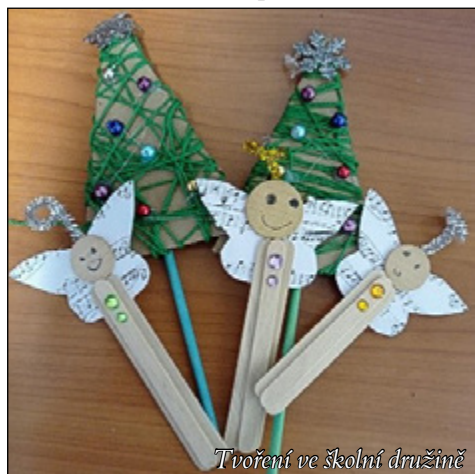
Tvoření ve školní družině

V malém oddělení školní družiny jsme v měsíci prosinci s dětmi tvořili výrobky na vánoční jarmark a pro Anvete Senior.