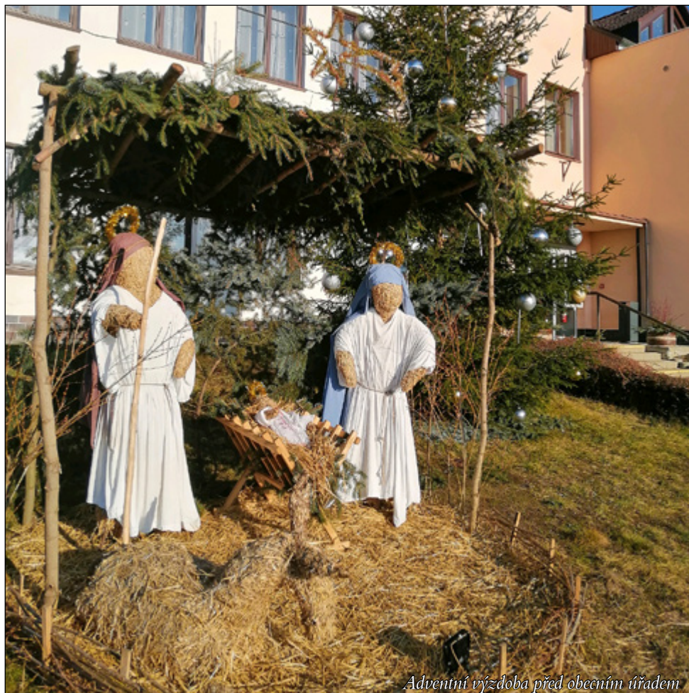
Adventní výzdoba před obecním úřadem