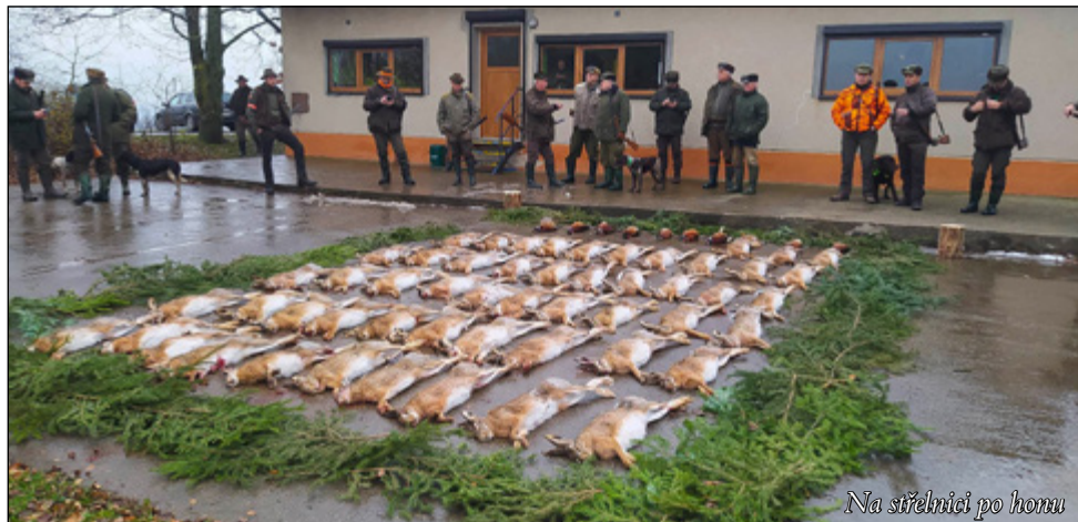
Na střelnici po honu