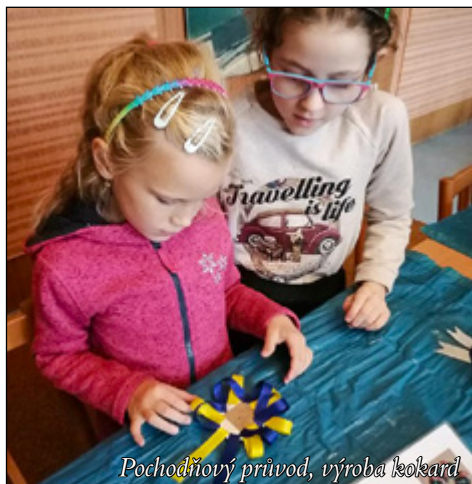
Pochodňový průvod, výroba kokard