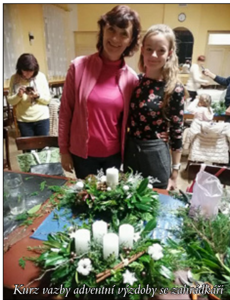
Kurz vazby adventní výzdoby se zahrádkáři

nevšední okamžiky svého života a „být při tom!“