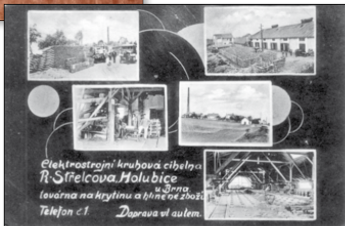
STŘELCOVA CIHELNA ROK 1930