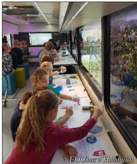
EDUbus v Holubicích

17. října 2022 jsme s dětmi navštívili EDUBUS – mobilní polytechnickou laboratoř. K obecnímu úřadu dojel starší autobus a v něm byla moderně vybavená