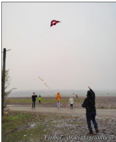
Florbal – drakiáda se sněhem

Na závěr bychom chtěli poděkovat dětem za sportovní výkony na zápasech