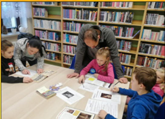
POCHODŇOVÝ PRŮVOD, NAPOLEONSKÝ KVÍZ