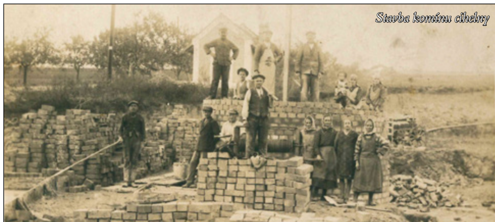
Stavba komínu cihelny