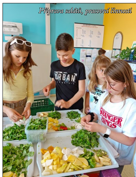
Příprava salátů, pracovní činnosti

Během tohoto školního roku jsme absolvovali spoustu aktivit podporujících všestranné vzdělávání – navštívilo nás dopravní hřiště, mobilní planetárium, 3D kino, záchranná stanice a exotická zvířata, jezdili jsme na plavání a na bruslení, podívali jsme se do Vidy v Brně. Žáci 4. a 5. ročníku se pravidelně každý měsíc setkávali