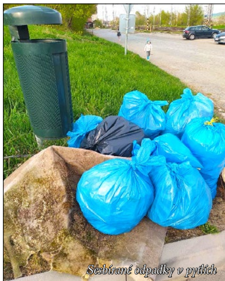
Sesbírané odpadky v pytlích

Na závěr chci poprosit všechny nezodpovědné lidi – ODPADKY PATŘÍ DO KOŠE, nebo ještě lépe DO TRÍDĚNĚHO ODPADU. Učme se to prosím každým dnem! 😊 Nebudme hloupí a líní. Všichni se přeje shodneme, že chceme mít kolem sebe hezčí, zdravější, a hlavně čistší prostředí 😊. Lubica Pekarovič