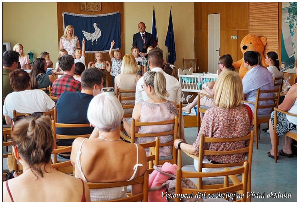
Vystoupení dětí ze školky na Vítání občánků