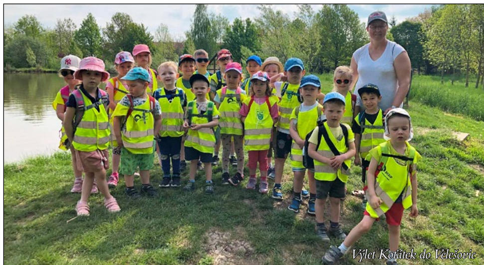
Výlet Kotátek do Velešovic