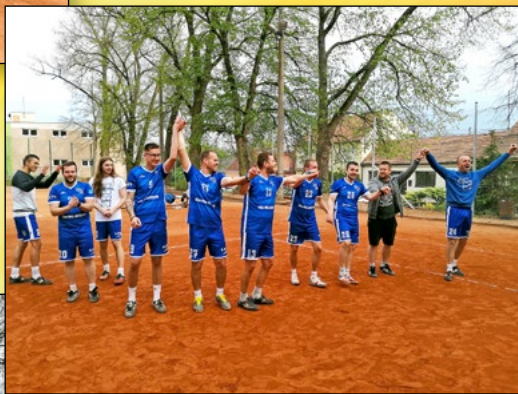
NOHEJBALOVÝ ZÁPAS O 1. MÍSTO S HOLICEMI