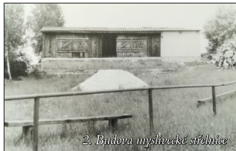
2. Budova myslivecké střelnice