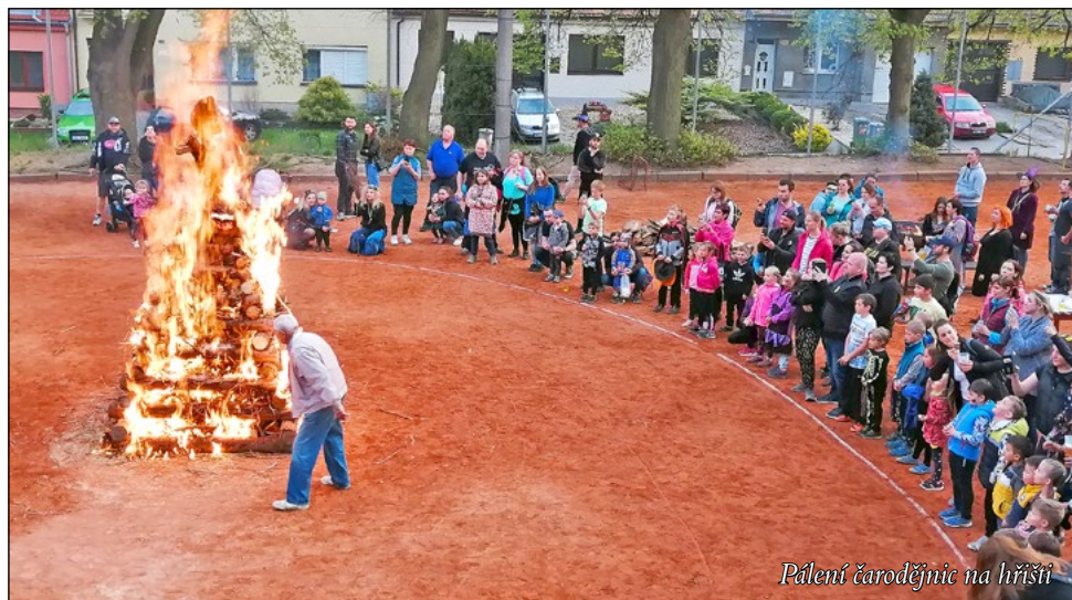
Pálení čarodějnic na hřišti