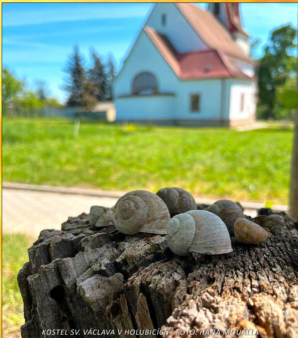
KOSTEL SV. VÁCLAVA V HOLUBICÍCH