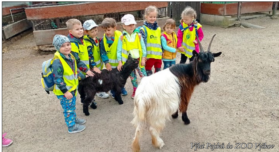
Výlet Pejseků do ZOO Vyškov

pěší výlet k velešovickým rybníkům. Navštívili jsme také místní dětské hřiště a osvěžili se nanukem. I přesto, že cesta nebyla nejkratší, všechny děti to zvládly na jedničku. V květnu celou MŠ čekaly dva výlety, do ZOO Vyškov a Lamacentra v Brně, které bylo pro děti velkým zážitkem. Vždyť jak často se nám poštěstí