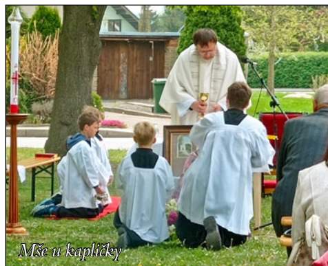
Mše u kapličky