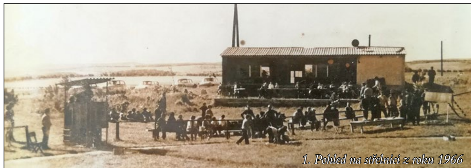
1. Pohled na střelnici z roku 1966

Za Myslivecké sdružení Holubice – Velešovice Oldřich Hrstka.