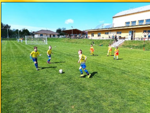
ZÁPAS FOTBALOVÉ PŘÍPRAVKY V KOMOŘANECH