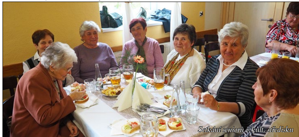
Setkání seniorů v kult. středisku