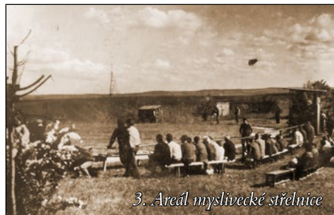
3. Areál myslivecké střelnice