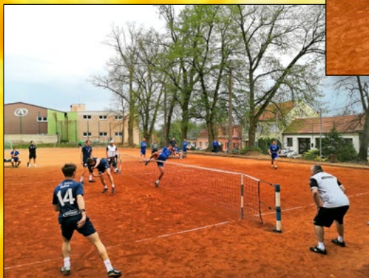
NOHEJBALOVÝ ZÁPAS O 1. MÍSTO S HOLICEMI