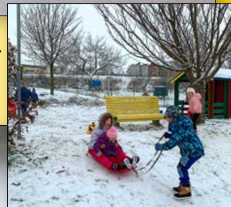
MŠ NA NÁVŠTĚVĚ V MÍSTNÍ DRŮBEŽÁRNĚ