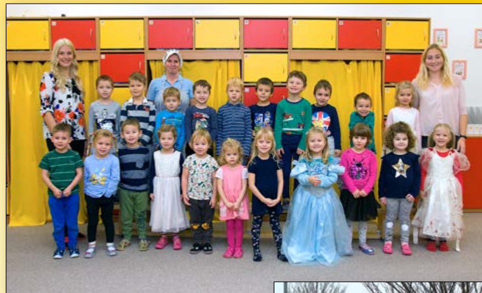
ZIMNÍ RADOVÁNKY VE ŠKOLCE →