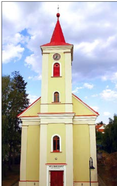
Kostel v Heršpicích