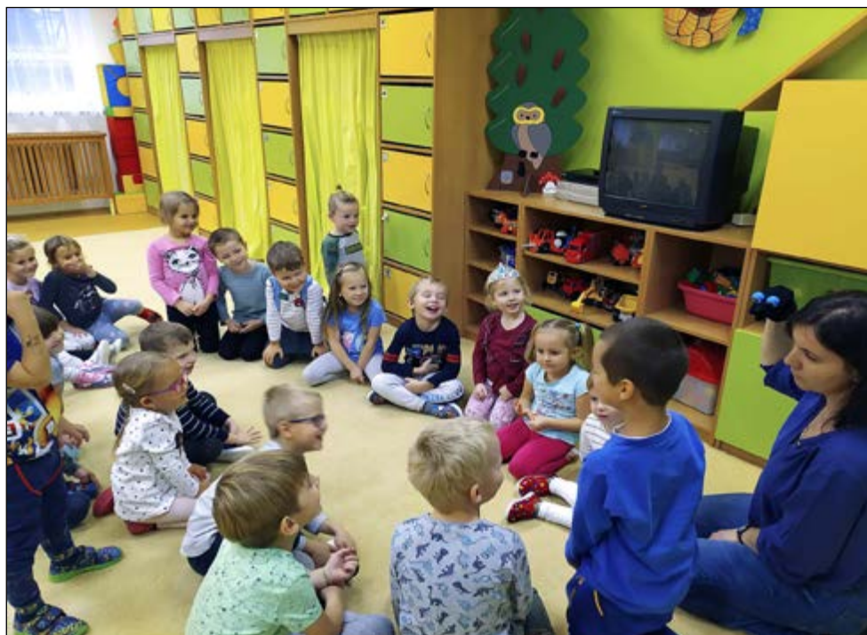
MŠ Pejsci - povídání s bacilem

a já věřím, že se bez problémů zapojí do našeho režimu.