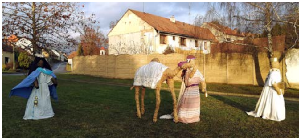
Tři králové s velbloudem

Postavy svaté Panny Marie, svatého Josefa a Ježíška v jesličkách před obecním úřadem, ovečky s pasáčkem a hlídačím psem, ale i postavy Tří králů s velbloudem na návsi před samoobsluhou jsou dílem zaměstnanců obce. Děkujeme jim za krásnou a vkusnou adventní výzdobu, četná pochvalná slova občanů