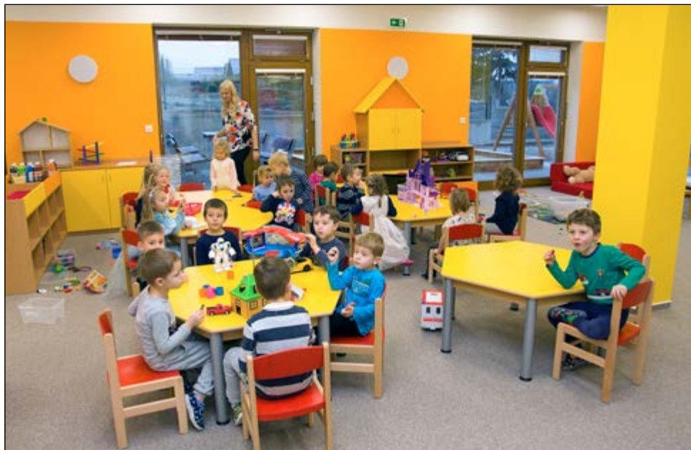
Otevření nové třídy MŠ