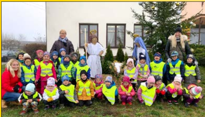
DĚTI ZE ŠKOLKY ZAZPÍVALY U SLÁMOVÉHO BETLÉMU A VÁNOČNÍHO STROMU

ročník 26 • číslo 4 • říjen–prosinec 2020