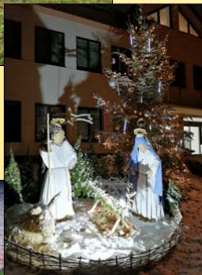
NASVÍCENÁ ADVENTNÍ VÝZDOBA PŘED OBEČNÍM ÚŘADEM