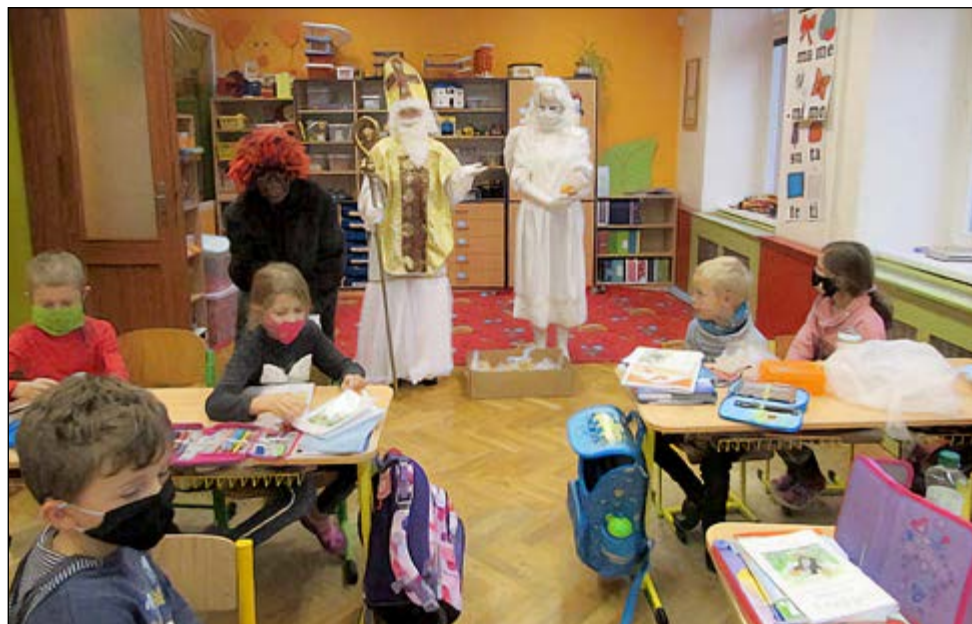
Mikuláš ve škole