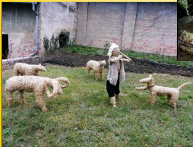
OVEČKY S PASÁČKEM A PSEM