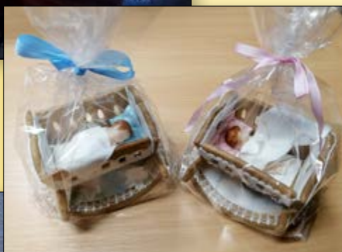
VÍTÁNÍ OBČÁNKŮ, PERNÍKOVÉ KOLÉBKY PRO DĚTI