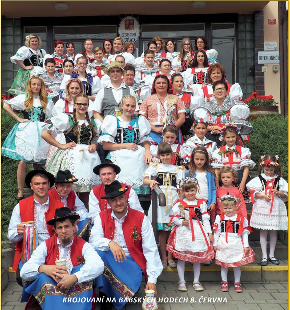
KROJOVANÍ NA BABSÝCH HODECH 8. ČERVNA