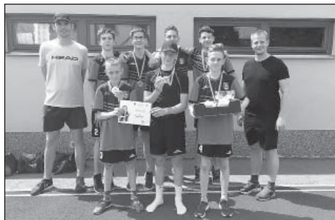
Finálový turnaj žáků

Žákovskému družstvu se podařilo, stejně jako B-týmu, vyhrát okresní přebor, a tak kluci opět po roce přebírali zlaté medaile.