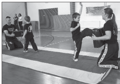
Dny zdraví - krav maga

mi na různá zdravotní témata, ve sportovní hale si mohli lidé vyzkoušet s profesionálními instruktory kurz krav magy a program na trampolínkách a bosu z Fit studia Slavkov. Mohli jsme se poradit s výživovým poradcem, nechat si pomalovat obličej, zakoupit kosmetiku a srdečně se zasmát na úžasné Józe smíchu v domově Anvete senior.