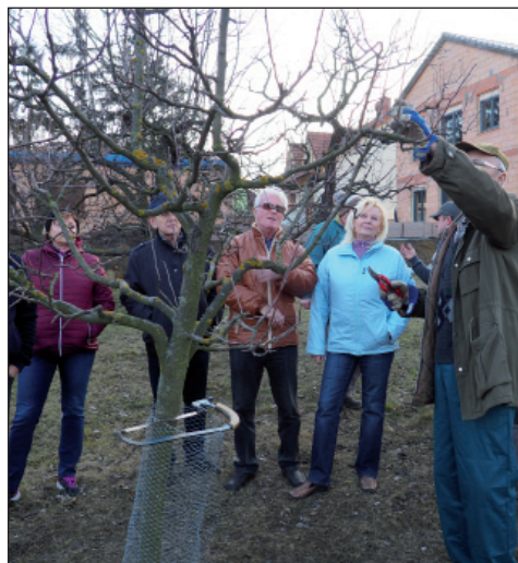
Instruktaž jarního řezu ovocných stromků

Moc jim všem děkuji za vstřícnost a ochotu.