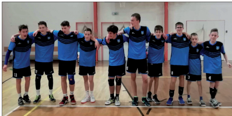
Družstvo kadetů na domácím turnaji

radost. Klukům bych chtěl tímto poděkovat za velmi dobrou tréninkovou i zápasovou docházku a za skvělý přístup. Věřím, že pokud se volejbalu budou věnovat i nadále, bude budoucnost volejbalu v Holubicích zase na jednu generaci zajištěna.